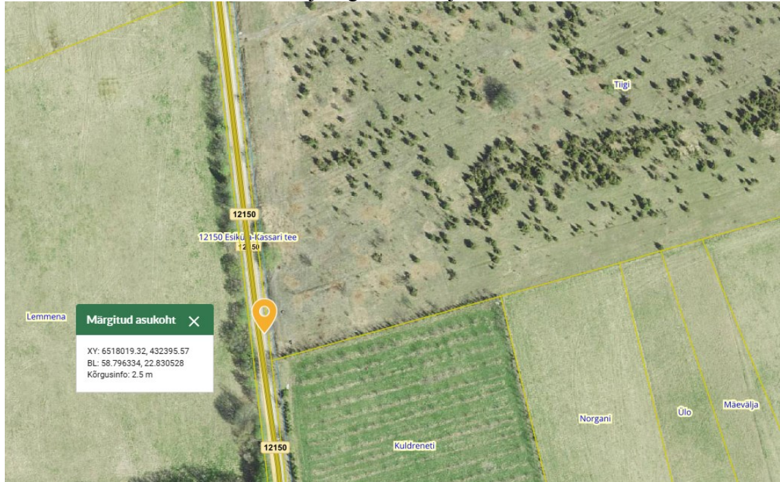
Joonis 1. Ristumiskoha asukoht tähistatud oranži tingmärgiga.